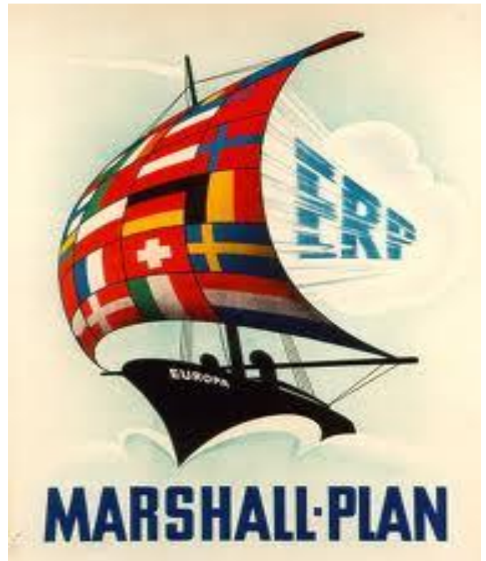
Affiche pour le Plan Marshall, réalisée par la Haute-Commission alliée (organe suprême des trois alliés occidentaux en RFA), 1950