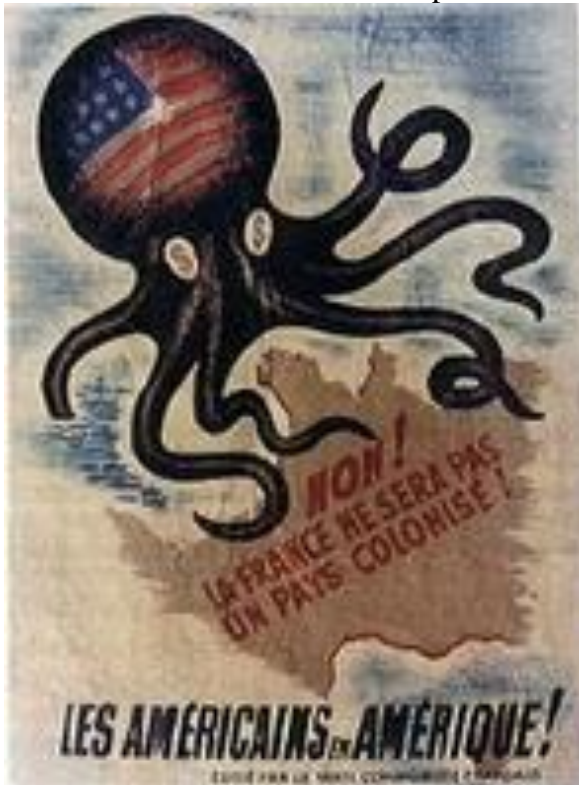
Affiche du Parti Communiste Français (vers 1950)